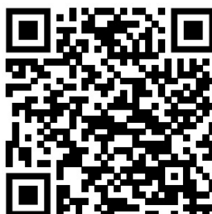
QR kód pro video návod